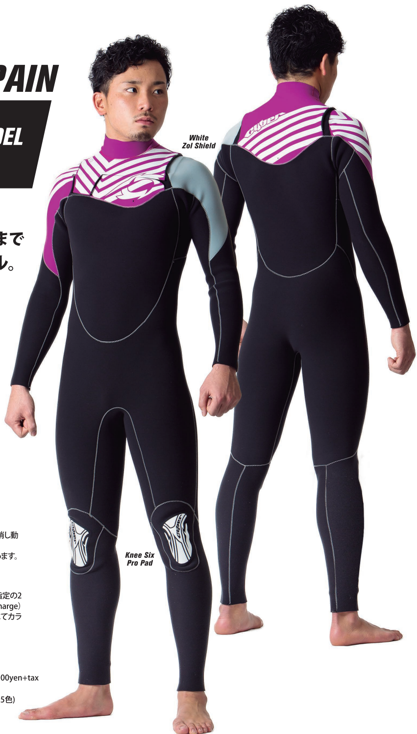
White Zol Shield